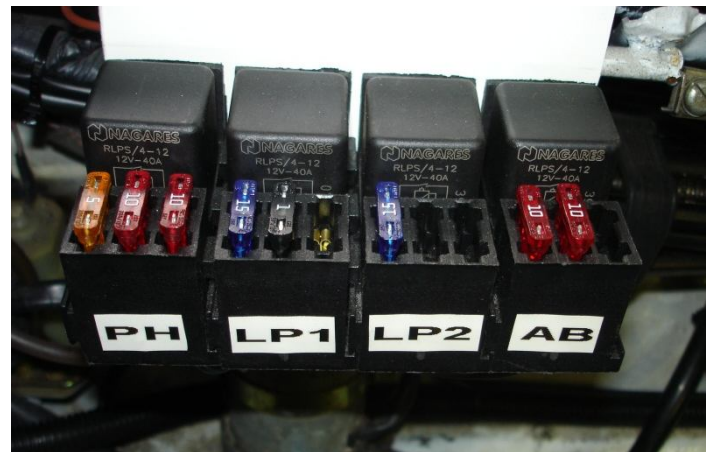
Relais + fusibles sur embase