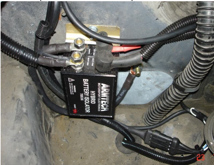
Coupe-circuit électronique ARMTECH