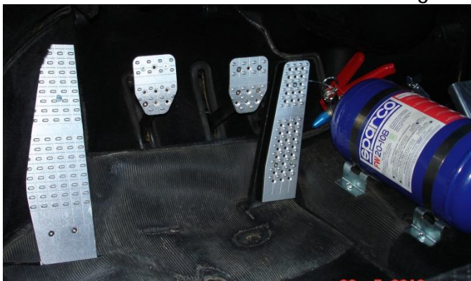
Pédalier aluminium – Extincteur 2 kg.