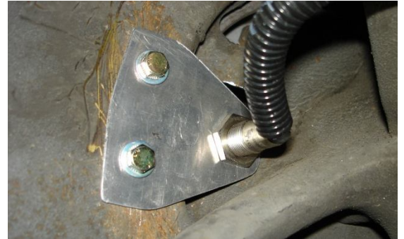
2 sondes de roue (Dr & Gh) avec inverseur de choix de la sonde au tableau de bord