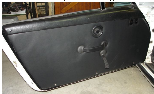
Panneaux de portes cuir type RS92