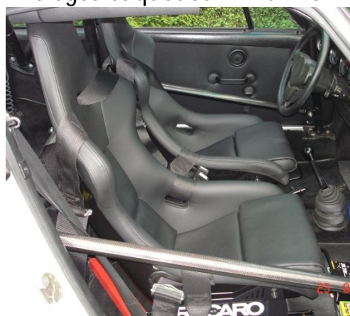
Sièges baquet cuir RECARO