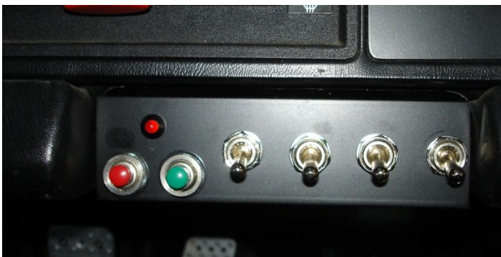
Interrupteur commande phares + coupe circuit sur platine alu à la place du cendrier.